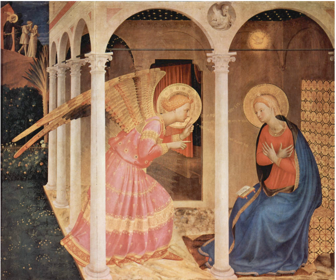
Fig. 7 L'Annonciation faite à Marie de Fra Angelico

On remarque que dans quasiment toutes les peintures de l' Annonciation faite à Marie la bouche de l'Archange Gabriel est à la même place que la «marionnette» des cultures bicamérales qui est la même place que la bouche de Régis.