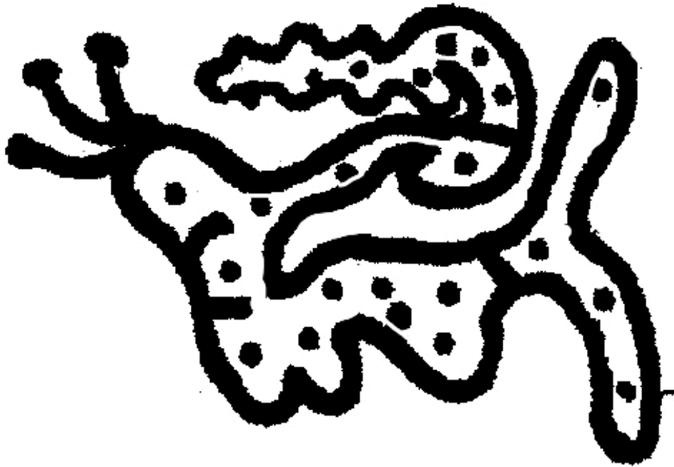
Fig. 5 Second escargot presque-cloisonné de Régis

Si l'on compare l'évolution des dessins de chats de Louis Wain avec l'évolution des trois dessins de Régis on observe une tendance à aller vers plus de cloisonnement.