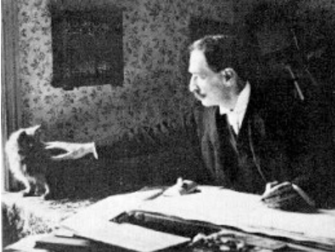
Fig. 3 Louis Wain et son chat

Louis Wain est né en 1860. Il devient peintre et s'intéresse particulièrement aux chats - ci-dessus et image 3a ci-dessous.