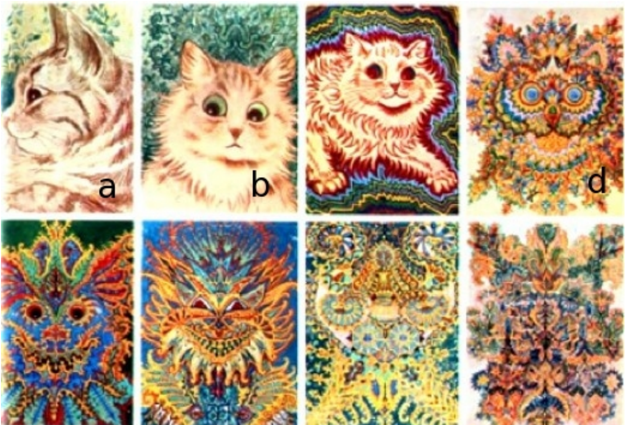
Fig 4: Les chats de Louis Wain

Louis Wain est né en 1860. Il devient peintre et s'intéresse particulièrement aux chats - ci-dessus et image 3a ci-dessous.